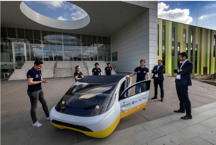
TU/e-studententeam dat de zonnwagen Solar bouwt op de Brainport Industries Campus. Met clusters als Brainport Eindhoven en de Food Valley in Wageningen heeft Nederland innovatiecentra van wereldklasse in huis, maar er is meer nodig om bedrijven te trekken.

Met clusters als Brainport Eindhoven en de Food Valley in Wageningen heeft Nederland innovatiecentra van wereldklasse in huis. Maar er is meer nodig. Met name op het gebied van verduurzaming en digitalisering liggen er kansen. Maar dan moet de overheid een actief industriebeleid voeren om de kansen te kunnen grijpen.